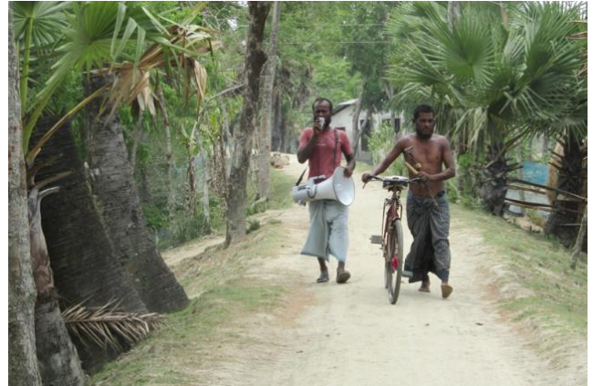
In Bangladesh waarschuwen vrijwilligers de mensen voor cycloon Fani, mei 2019

Samen met de lokale overheden maken de comités goed doordachte rampenplannen en nemen de maatregelen die nodig zijn. Zoveel mogelijk met eigen middelen, maar ook door de overheid aan te spreken op haar verantwoordelijkheid. Een goede voorbereiding en het beperken van de gevolgen zorgen er samen voor dat de schade minder groot is en dat mensen en hun omgeving sneller herstellen van een ramp.