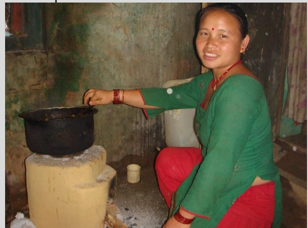
Een voorbeeld van zo'n kookplaats in Nepal

Een bewezen effectief middel is een verbeterde kookplaats. Deze kookplaatsen gebruiken veel minder brandstof, zodat bomen en struiken blijven staan en kunnen aangroeien tot natuurlijke bescherming tegen overstromingen en erosie. Daarnaast zijn de nieuwe kookplaatsen minder gevaarlijk en vervuilend. Dat komt de gezondheid van vrouwen sterk ten goede en ook het brandgevaar neemt af. Zulke kookplaatsen worden gebruikt in Bangladesh en Nepal. Mensen worden getraind in het maken en aanleggen van deze kookplaatsen die ze zelf met eigen middelen kunnen produceren.